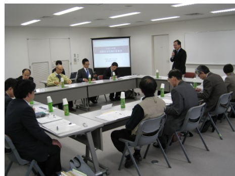
【昨年度の委員会の様子】

内容：1) 事故ゼロプランの進捗状況 2) 目標達成度評価 3) 事故危険区間の追加選定 4) その他